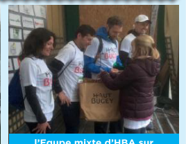
L'Equipe mixte d'HBA sur la première marche du podium