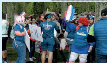
Même la gendarmerie de Nantua se lâche !