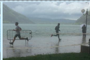
Un temps à ne pas mettre un athlète dehors